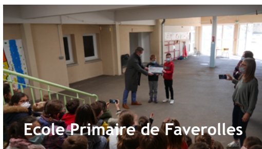
Ecole Primaire de Faverolles